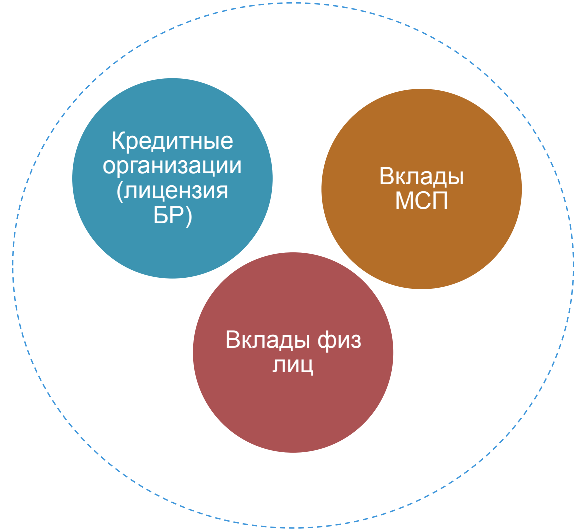
Система страхования вкладов

В число участников системы страхования вкладов (в том числе вкладов малого бизнеса) входят кредитные организации, имеющие разрешение Банка России на привлечение во вклады денежных средств физических лиц